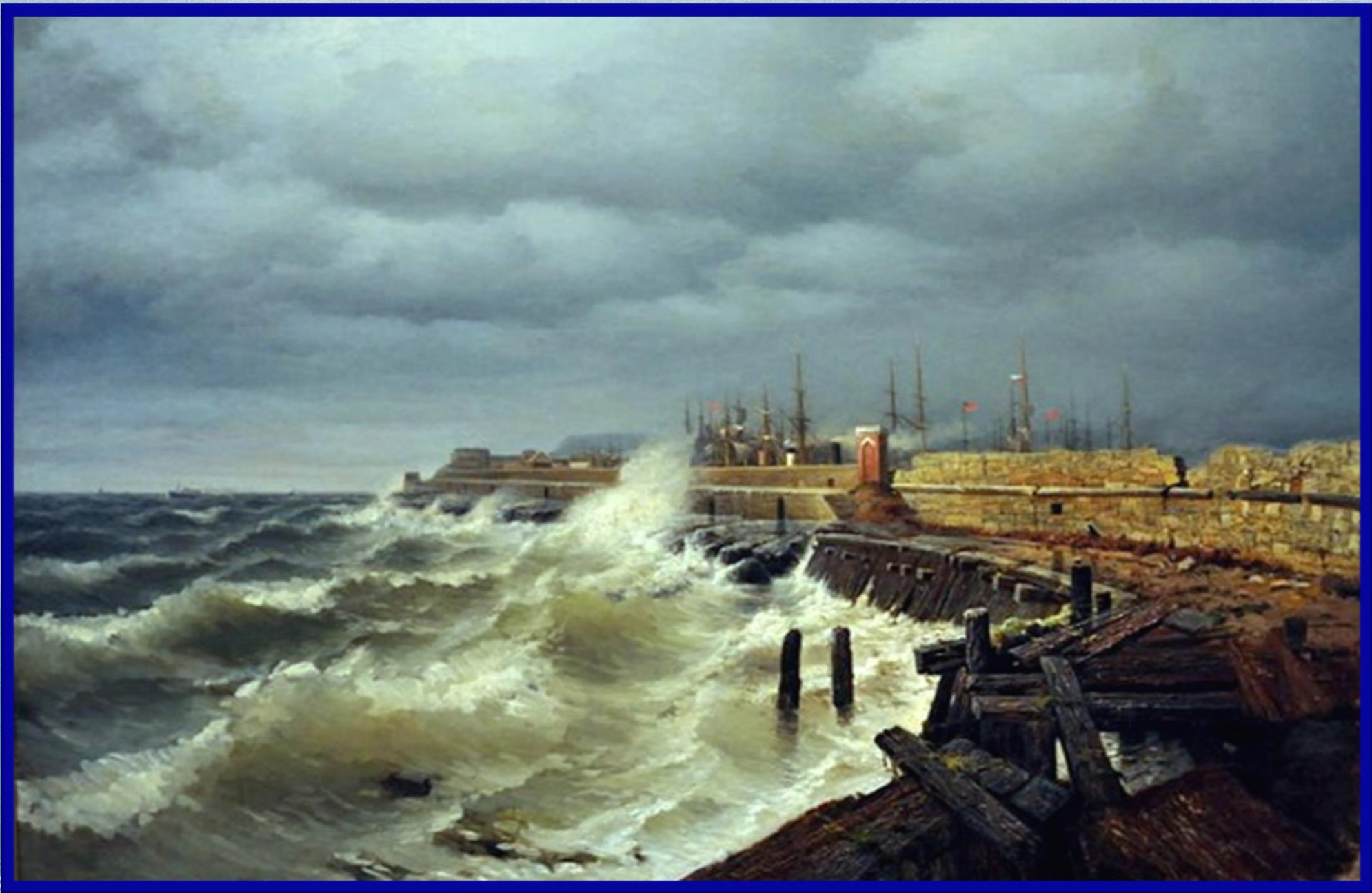
Р. Судковский «Одесский волнолом»