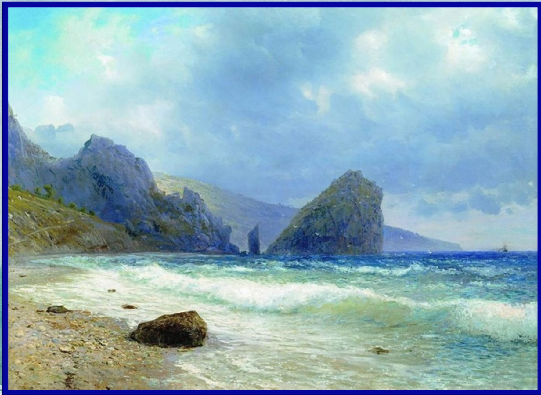
Л. Лагорио «Скалы Дива и Монах»