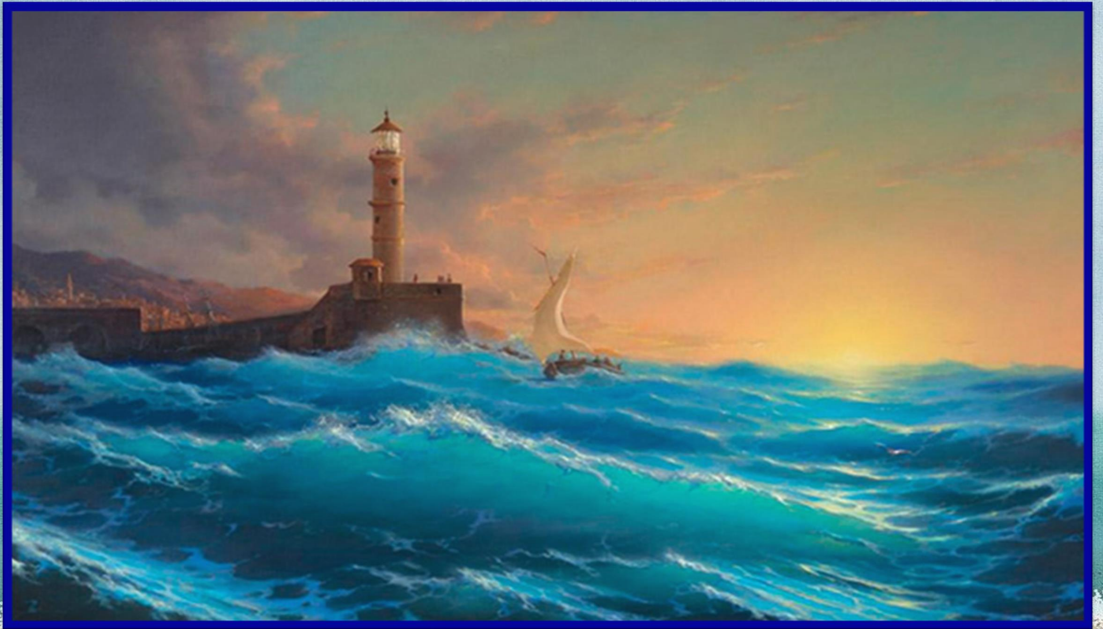
Г. Дмитриев «Маяк и солнце»