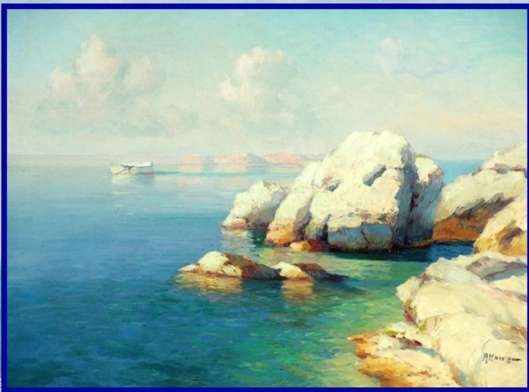
А. Танзен «Морской пейзаж. Бухта»