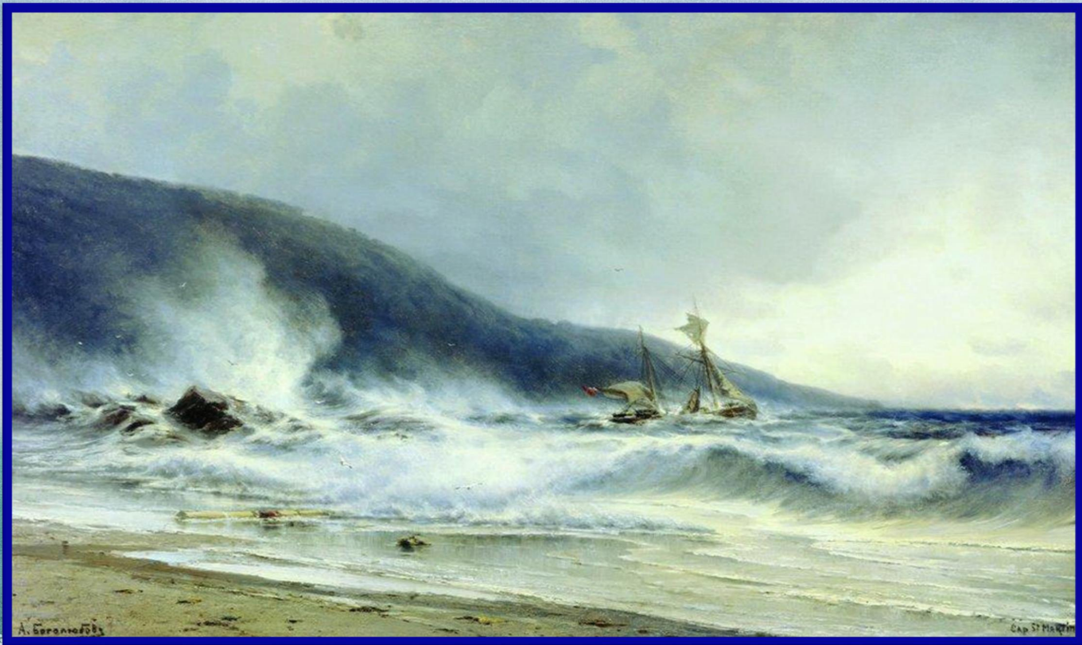
А. Боголюбов «Прибой у мыса Сен-Мартин»