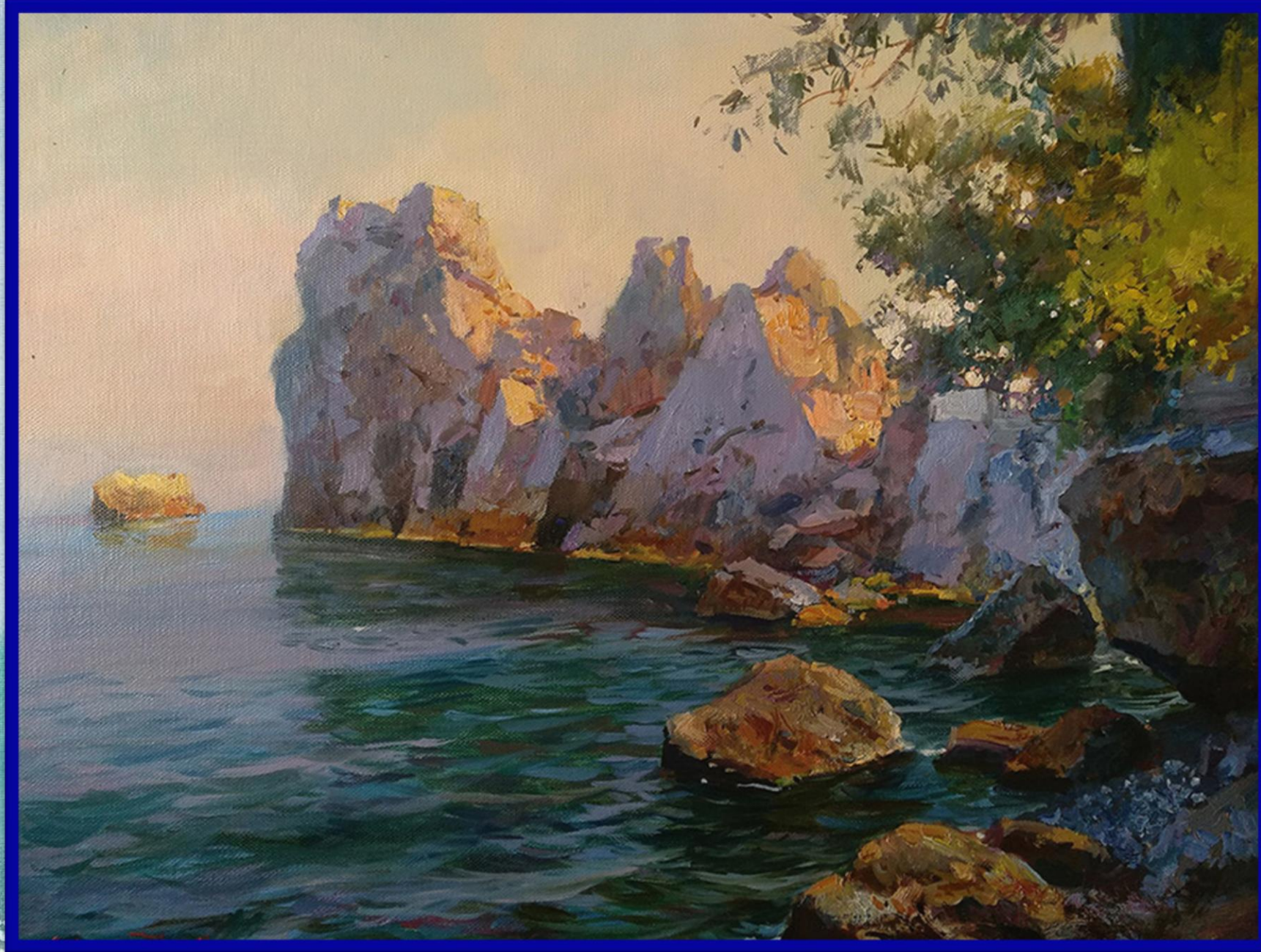
С. Свиридов «Чеховская бухта. Турзуф»