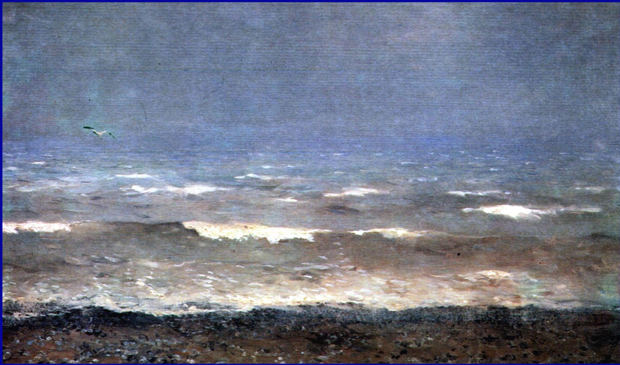
И. Левитан «Берег Средиземного моря»