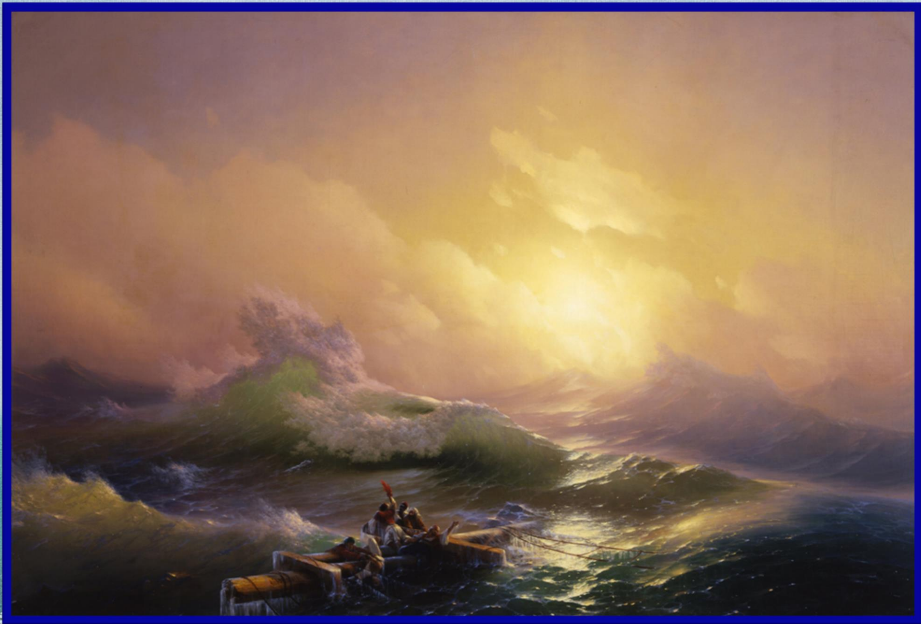
И. Айвазовский «Девятый вал»