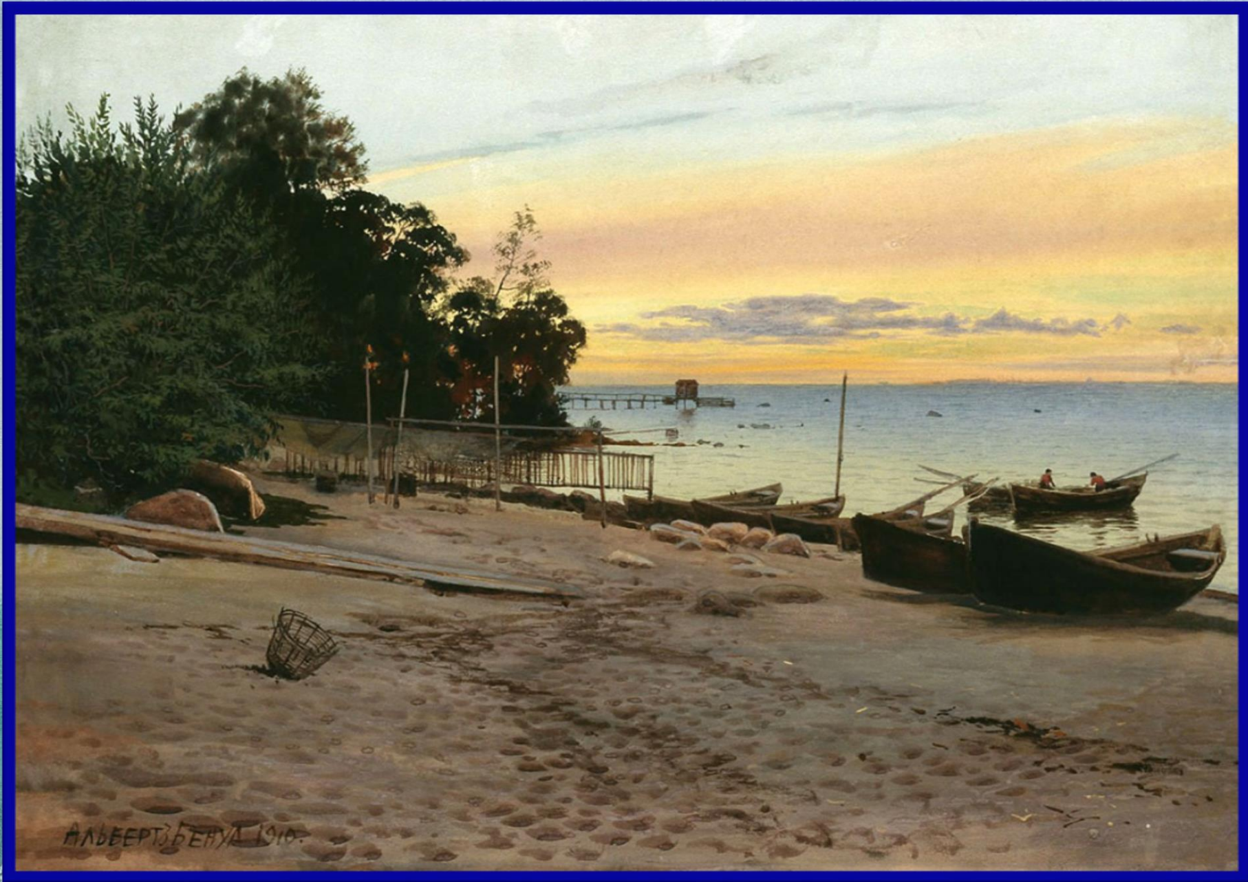
А. Бенуа «Вечер на възморье»