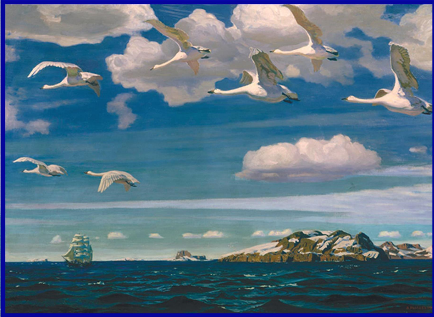
А. Рылов «В голубом просторе»