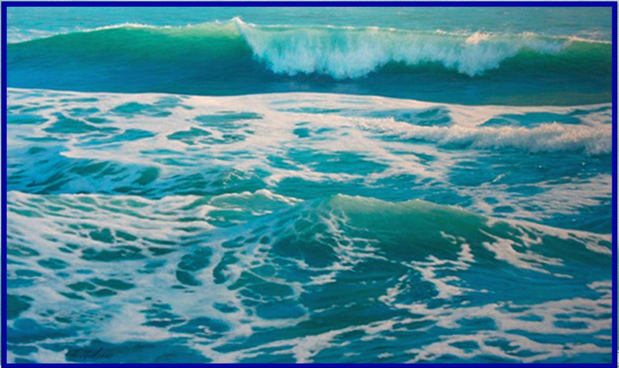
Т. Фельсон «Изумрудный прибой»